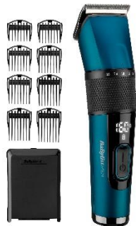
E990E € 15 CASHBACK € 99,90