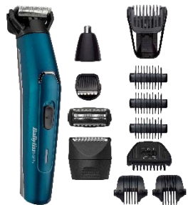
MT890E € 10 CASHBACK € 79,90