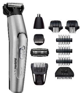
MT861E € 10 CASHBACK € 59,90