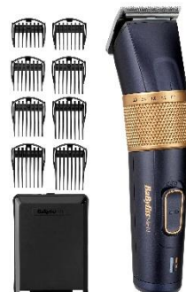
E986E € 10 CASHBACK € 79,90