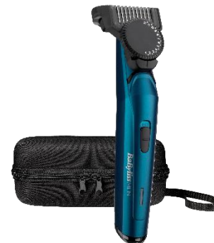
T890E € 10 CASHBACK € 79,90