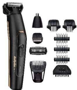
MT860E € 10 CASHBACK € 59,90