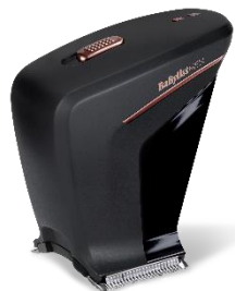
SC758E € 15 CASHBACK € 74,90