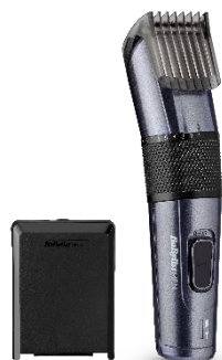
E976E € 5 CASHBACK € 49,90